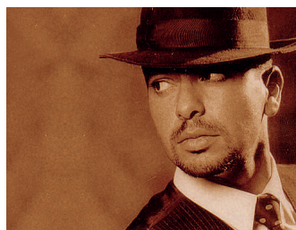
DJ OSVALDO Argentine/Espagne