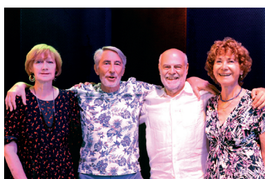
Equipe organisation France